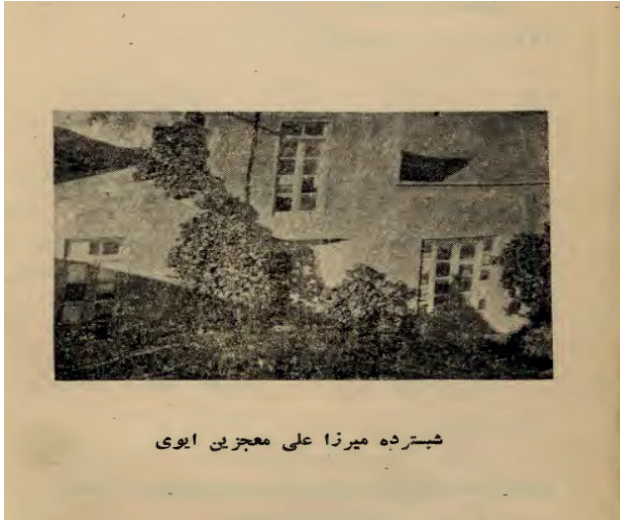
Şekil 2. Şebüster’de Mirza Ali Möcüz’ün evi

Möcüz danışar bal kimi, aç ağzuvi, dinlə, Qəndi 6 , rütəbi 7 , şərbəti neylərsən, əmoğlu? (Möcüz, 2007:111)