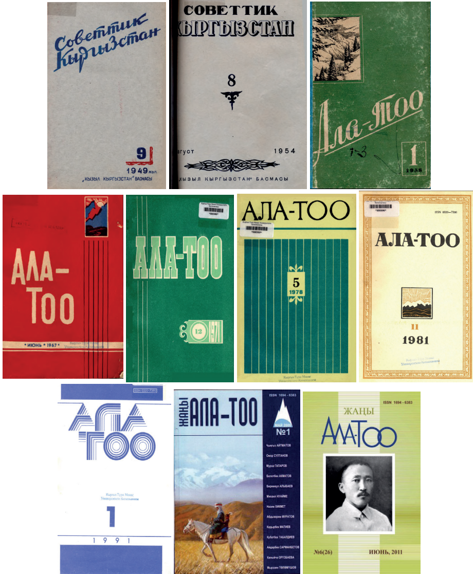
Resim 1: Derginin çeşitli yıllara ait kapak resimleri