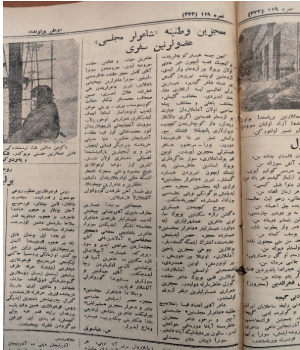
Şəkil 5. Möcüzün vətəninə “Şairlər Məclisi” üzvlərinin səfəri

(Vətən yolunda gazetesi, 1945, 10 Ekim, № 119, Tebriz.)