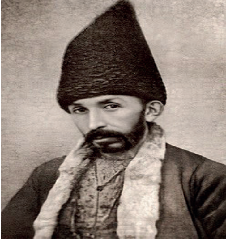
Mir Möhsün Nevvab (1833-1918)