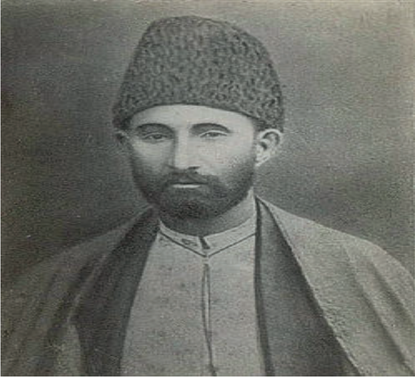
Seyid Azim Şirvani (1833-1888)