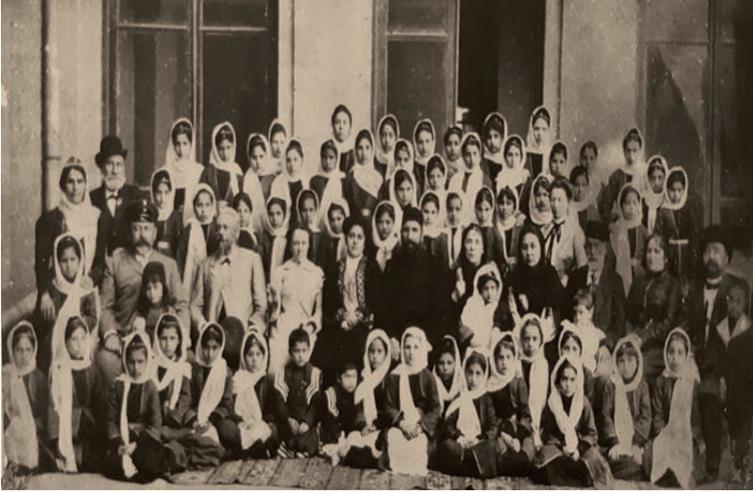
H.Z. Tağıyevin İmperatriça Aleksandra Kızlar okulu (1901)